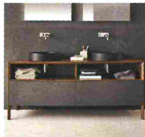
NEUTRA BY ARNABOLDI ANGELO INKSTONE design Steve Leung, Luca Martorano, Nespoli e Novara

Collezione di elementi per il bagno. Lavabi, vasche, piatti doccia e mensole dal design contemporaneo, rivestimenti dalle texture raffinate e complementi d'arredo intagliati in legni rari e preziosi sono il risultato di un dialogo ispirato tra materiali naturali e tecnologie evolute. Tra questi, i lavabi d'appoggio di Steve Leung in pietra Black Rock; il Mobile Neos, in legno massello Noce con frontali in pietra Basaltina di Luca Martorano; il rivestimento e il pavimento Earth, in pietra Basaltina, design: Nespoli e Novara.