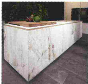
VASELLI MARMI OCO VASELLI KITCHEN design Emanuel Gargano e Marco Fagioli

Appassionato lavoro, attenzione per il dettaglio e design accurato sono le caratteristiche di questo sistema, per la cui realizzazione si sono impiegate le tecniche sia della produzione industriale che delle capacità artigianali. I top con lavabo scavato in pietra sono dei veri e propri pezzi unici, ognuno dei quali con caratteristiche estetiche diverse. Dettaglio distintivo è l'accoppiamento a 45 gradi che si legge tra il top, le ante e i fianchi, elemento che dona al progetto grande uniformità stilistica e leggerezza.