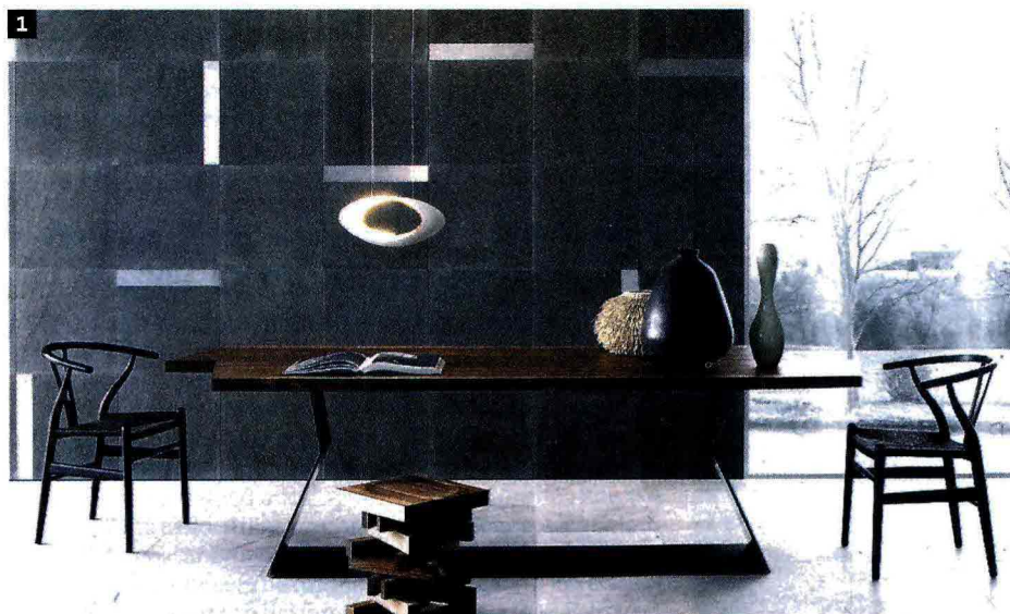
1. Neutra, Augmented Texture, design Elia Nedkov (da 200 euro al mq). 2. Mutina, collezione Tex, design Row Edges (da 218 euro al mq). 3. Xilo1934, collezione 1934Design. Parquet con decoro di Luca Scacchetti (da 47 euro al pezzo/doga). 4. Ceramica Sant'Agostino, Flexible Architecture, design Philippe Starck. In produzione da aprile. 5. Lithos Design, serie Drappi di Pietra, design Raffaello Galiotto (da 1.512 euro al mq)