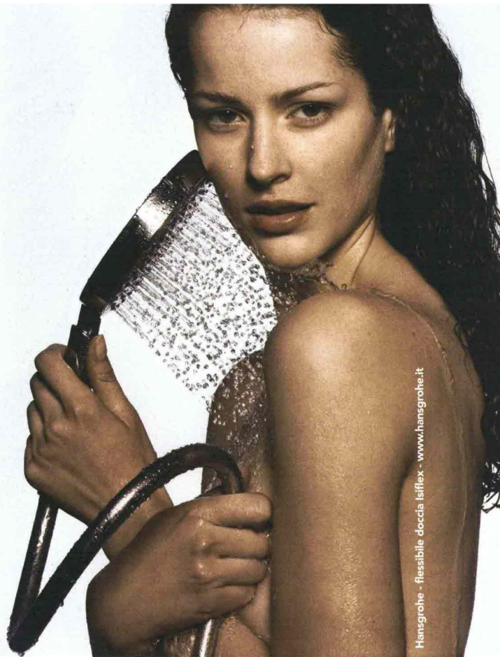
Hansgrohe - flessibile doccia Isiflex - www.hansgrohe.it