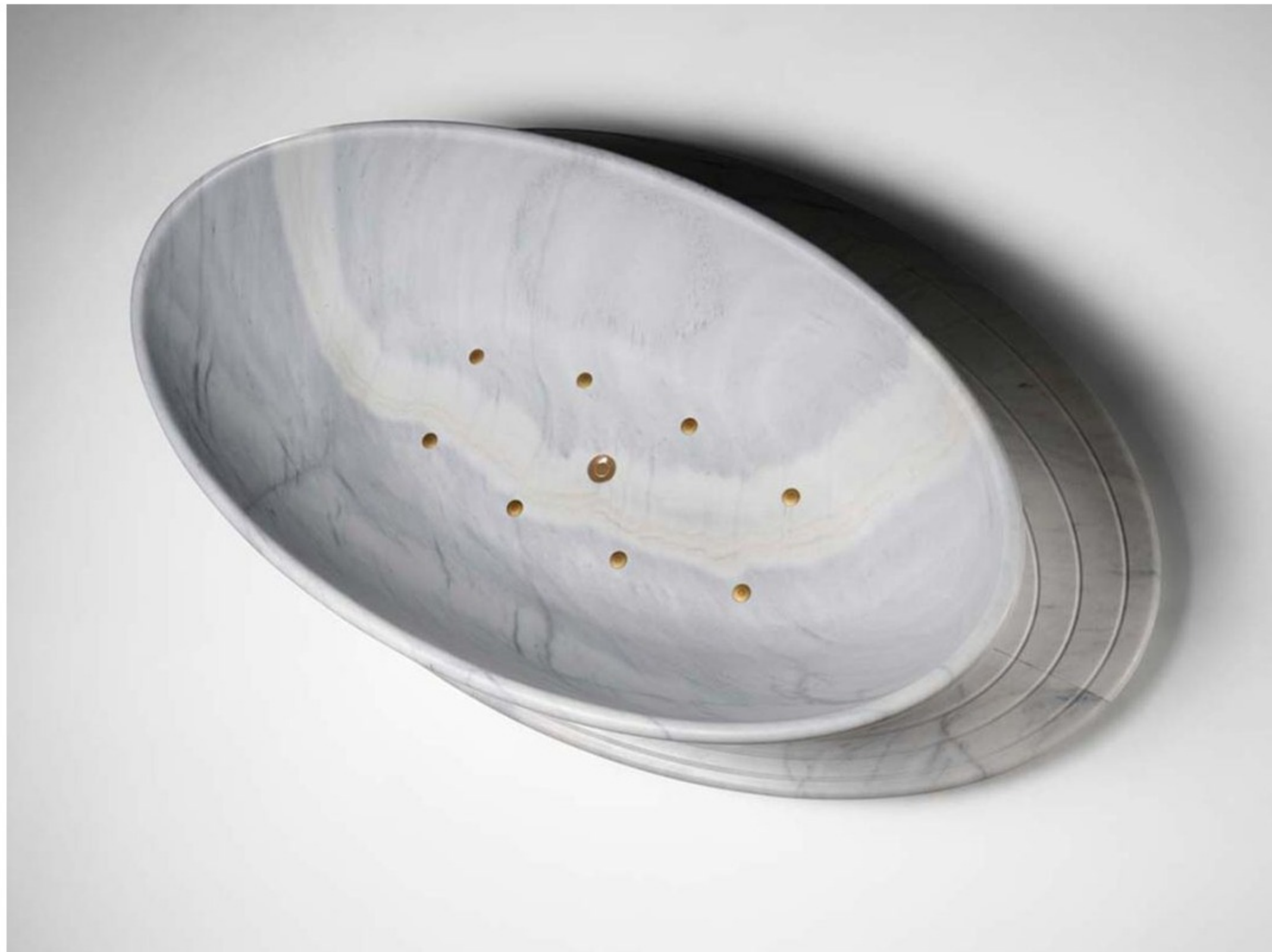
Palma by Neutra, design Foster + Partners