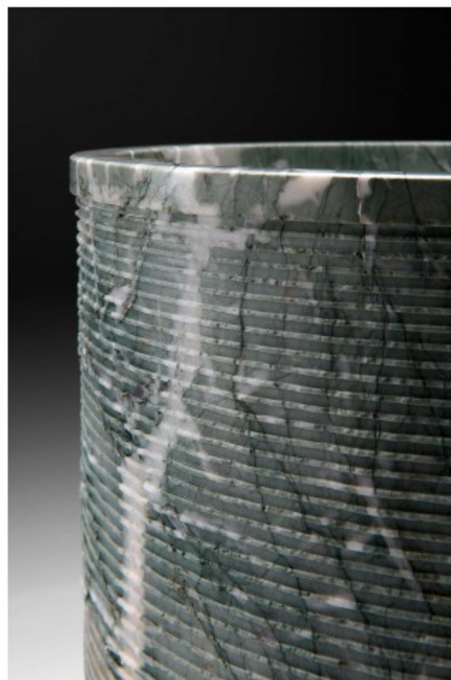
Minimal M6 by NEUTRA, design Nespoli e Novara

La filosofia di NEUTRA si esprime compiutamente nelle proposte per il bagno, spazio del benessere e della sensorialità. Qui la pietra naturale vibra in tutta la sua potenzialità tattile, richiamando la forza della natura e la sua inesauribile energia. NEUTRA guarda dunque a un design contemporaneo, enfatizzato da rivestimenti dalle texture raffinate: nascono così lavabi, vasche, piatti doccia, mensole, frutto di un dialogo tra materiali naturali e tecnologie evolute.