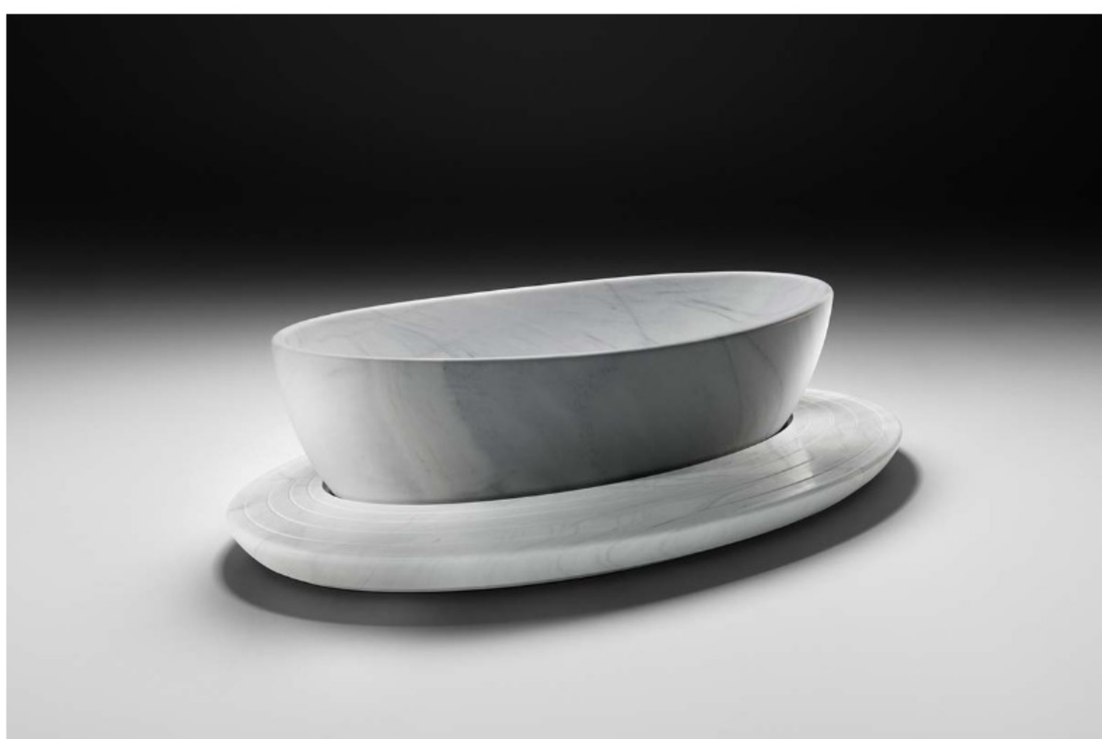
Palma by NEUTRA, design Foster + Partners

Un lavoro a quattro mani per realizzare una serie di arredi tra i quali vasca, lavabo e mensola sospesa in un elegante Bianco Covelano, direttamente ispirati alla forma architettonica del Palm Flower. Protagonista assoluta è proprio la vasca, ricavata da un unico blocco di marmo e integrata nell'architettura: ricorda un petalo galleggiante sulla superficie dell'acqua, con le sue linee fluide e i contorni levigati, al confine tra opera d'arte e oggetto funzionale.