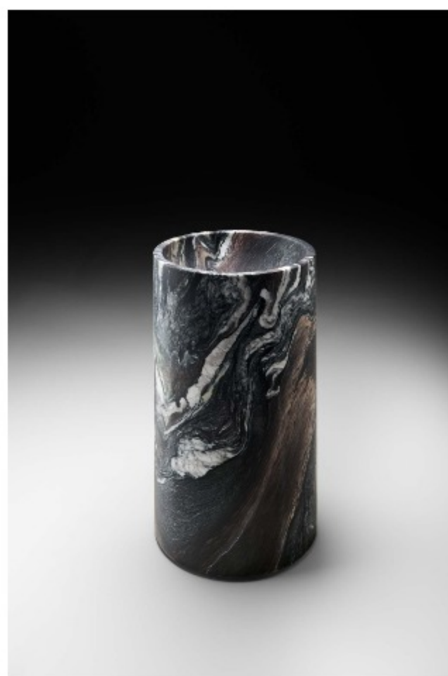
Minimal M6 by NEUTRA, design Nespoli e Novara