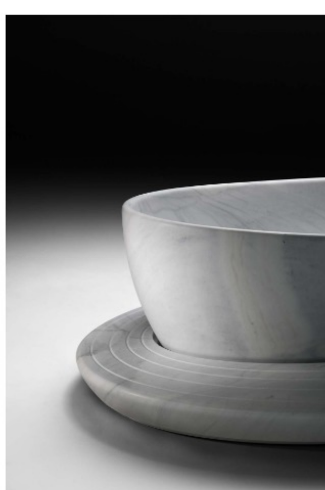
Palma by NEUTRA, design Foster + Partners

Un lavoro a quattro mani per realizzare una serie di arredi tra i quali vasca, lavabo e mensola sospesa in un elegante Bianco Covelano, direttamente ispirati alla forma architettonica del Palm Flower. Protagonista assoluta è proprio la vasca, ricavata da un unico blocco di marmo e integrata nell'architettura: ricorda un petalo galleggiante sulla superficie dell'acqua, con le sue linee fluide e i contorni levigati, al confine tra opera d'arte e oggetto funzionale.