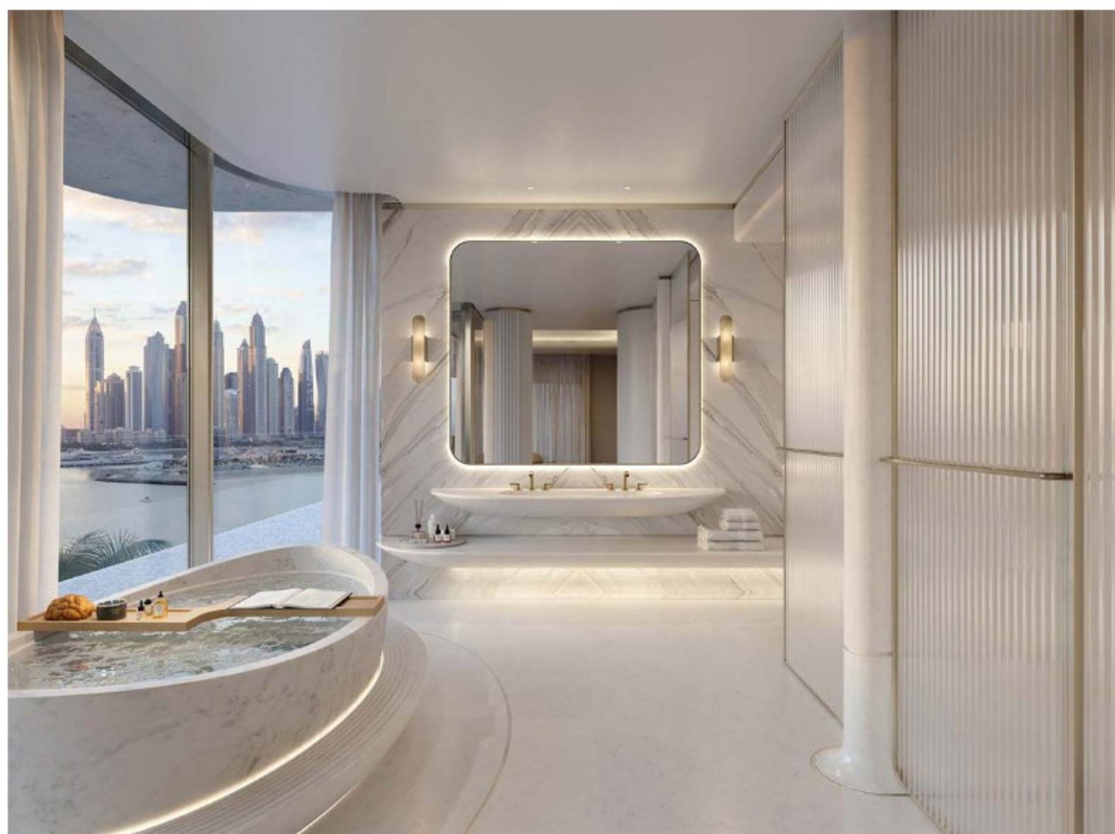
Palm Flower, Palma Jumeirah, Dubai

L'estetica va quindi di pari passo alla versatilità, così l'expertise di NEUTRA si declina su scale differenti, tanto nel prodotto quanto nel progetto. Per questo motivo il marchio è stato scelto dal rinomato studio Foster + Partners per realizzare il progetto degli spazi bagno dei 11 appartamenti del luxury building residenziale "Palm Flower" che sorgerà sul "tronco" del Palm Jumeirah a Dubai.