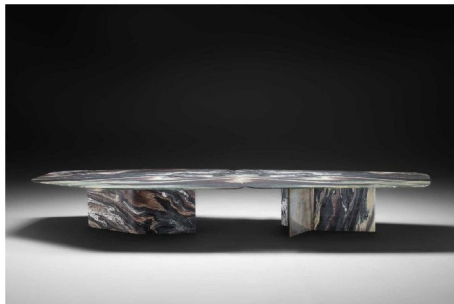
Draw Studio hat für „Islas“ zwei unterschiedliche asymmetrische Formen designt, die kombiniert werden können.

NEUTRA ist ein italienisches Unternehmen, das sich auf die Verarbeitung von Marmor und Naturstein spezialisiert hat. Diese Materialien stehen traditionell für Stabilität und Härte, im Lauf der Zeit jedoch und mit zunehmender Expertise in der Herstellung, wird mehr Weichheit in den Formen angestrebt. Eine neue Ebene wurde mit dem Tisch „Islas“ erreicht. Entworfen von DRAW Studio besticht dieses Möbel durch seine Balance aus Eleganz und Dynamik. Die leichte Tischplatte, die sich durch fließende Kurven und straffe Bögen auszeichnet, kontrastiert mit der monolithischen Basis aus massivem Marmor und handgefertigten Metallkeilen.