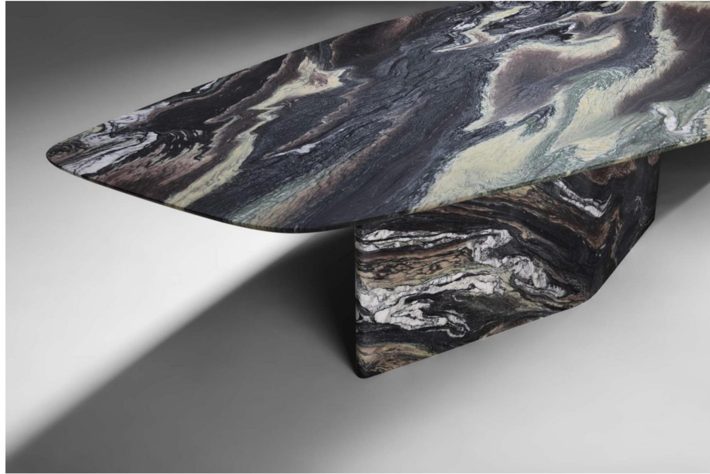
Expressiver Cipollino-Marmor und Metallbeine mit handpoliertem, brüniertem Messingfinish machen den Charakter des Tisches „Islas“ aus. © NEUTRA

von Caroline Wanderberg | 21. Januar 2025